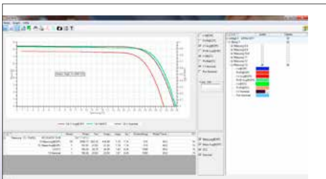
Auswertung der U-I Kennlinie und der Messergebnisse am PC