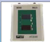
HT304N Duo Referenzzelle für Einstrahlungsmessung