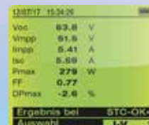
Große grafische Anzeige, alle notwendigen Messwerte können gleichzeitig abgelesen werden