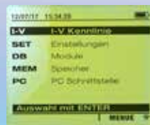
Einfache, klar strukturierte Menüführung, intuitiv bedienbar, 6 Sprachen stehen zur Auswahl