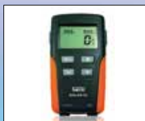
SOLAR-02 externer Datenlogger (optional)