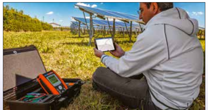
Auswertung und Protokollerstellung der U-I Kennlinie mit Ihrem Smartphone oder Tablet und der App HTANALYSIS™