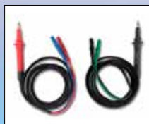
KITKELVIN Messleistungsset (optional) In Funktion Auto-Sequenz Messung automatisch starten und speichern.