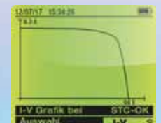
Ergebnisse können sofort grafisch als I-U Kennlinie dargestellt werden, inklusive automatischer Auswertung OK / Nicht OK