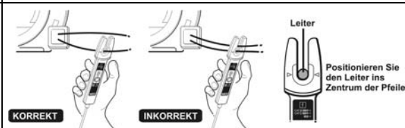
KORREKT INKORREKT Positionieren Sie den Leiter ins Zentrum der Pfeile