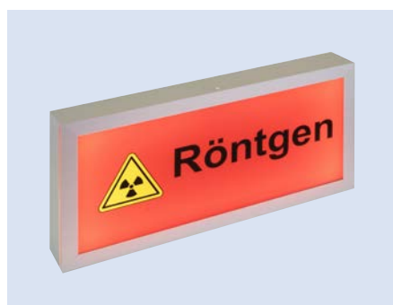
Aufputzgehäuse aus Aluminium