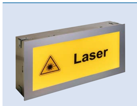
Unterputzgehäuse mit Aluminium Blendrahmen