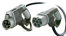
Ladekabel Typ 1 – Typ 2 AC 1-phasig 32A Kabellänge = 4m