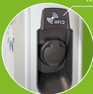
Optional mit RFID-Reader