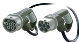
Ladekabel Typ 2 – Typ 2 AC 3-phasig 32A Kabellänge = 4m